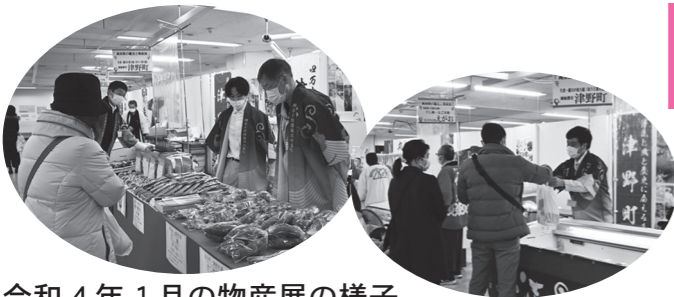
令和4年1月の物産展の様子

1月11日(水)～16日(月) 10時～18時30分 ※最終日は17時までとなります。