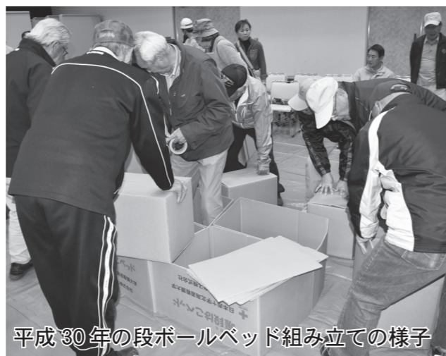
平成30年の段ボールベッド組み立ての様子