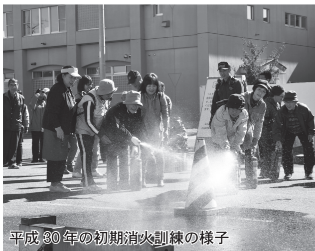
平成30年の初期消火訓練の様子