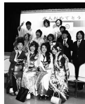
大人への第一歩踏み出す

成人式が、1月9日公民館で行われ、男女合わせて46人が出席しました。振り袖などを着飾った新成人が、久しぶりに再会した同級生と楽しそうに過ごしていました。