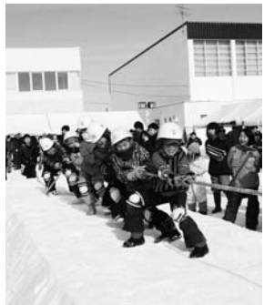
歯をくいしばって!

2月2日に開かれた恒例の「さむさむまつり」。寒さの中、子どもたちは、歯をくいしばって綱を引き、勝っても、負けても、息をきらせていました。