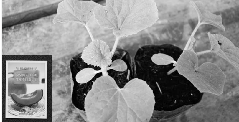
定植直前のメロンの苗と振興会設立 40 周年記念誌（左下）