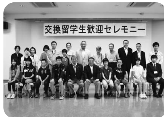
交換留学生歓迎セレモニー