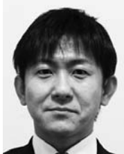
交流を深めてきます