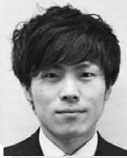
訓子府町の皆さんへ