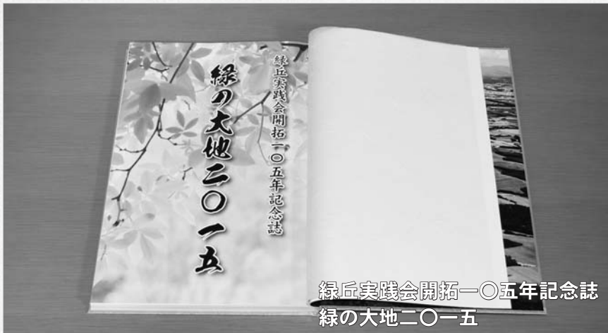
緑丘実践会開拓一〇五年記念誌 緑の大地二〇一五