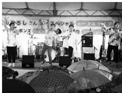
鳴子おどり(右) ジャアバーボンスのライブ(左)

会場には、たくさん夜の店が立ち並び、お盆で里帰りしている人や町内外からの人出で大いににぎわいました。