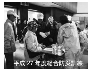
平成27年度総合防災訓練

今年の総合防災訓練は、地震を想定した訓練を計画しています。訓練内容など、詳細は10月号広報でお知らせします。防災意識高揚のため、防災訓練に皆さんの参加をお願いします。 ○主な訓練内容（予定） ・シェイクアウト訓練 ・情報収集・伝達訓練 ・住民避難訓練 ・避難所運営訓練 ・炊き出し・試食 ・防災対策車両の展示など