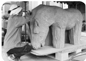
彫刻作品（石彫）公開制作

彫刻作品の公開制作では、町の発展を支えた「馬」を制作し、訓子府らしさを表現した作品を作り、彫刻ワークショップでは、参加者それぞれが想像を膨らませて「馬」のテラコッタ（素焼き粘土）を作るなど武蔵野美術大学と連携したアート事業が行われ、文化・芸術のまちづくりを盛り上げました。