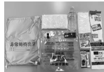
防災備蓄品の一例