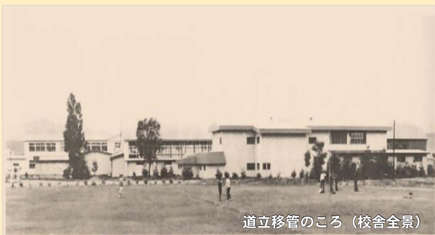
道立移管のころ(校舎全景)

訓子府高校は、昭和23年11月5日に「北見高等学校(現北海道北見北斗高等学校)訓子府分校」として創立してから今年で70周年を迎えました。