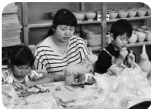
彫刻ワークショップ