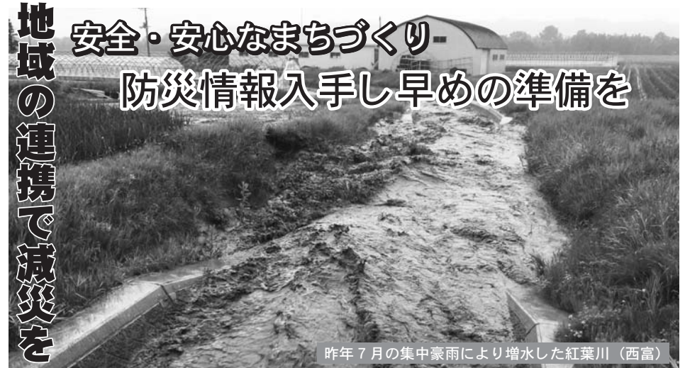
昨年7月の集中豪雨により増水した紅葉川(西富)