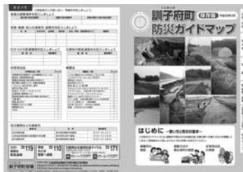
訓子府町防災ガイドマップ

避難情報が発令された場合は発令地区の避難所が開設されるほか、避難情報の発令前であっても自主的に避難される方のために必要とされる避難所を開設することがあります。災害の種類に応じて避難所が異なります。