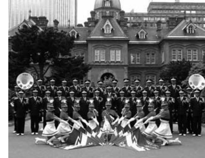
北海道警察ホームページより