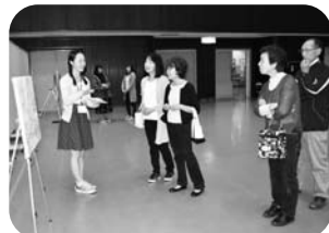
対話型作品鑑賞会