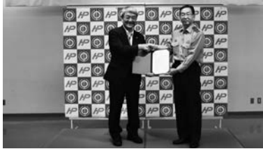
訓子府町防犯カメラ画像提供に関する協定書手交式

犯罪が発生した場合、警察からの犯罪捜査に関する防犯カメラの画像提供の依頼に応じることを目的としています。このとき、個人のプライバシーは保護され、不要となった場合は、速やかに削除されます。