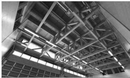
県産材をふんだんに使い、 温もりと落ち着きのある内外装