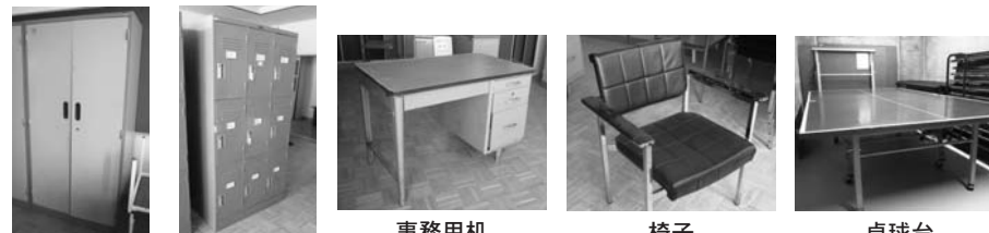
ロッカー ロッカー（9間口）