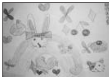
「いきものとクローバー」