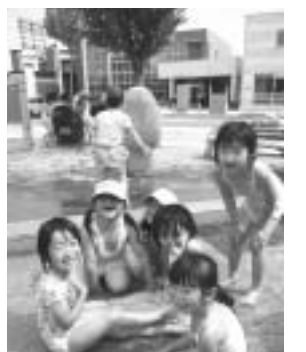
冷たくて気持ちいい

6月10日、訓子府幼稚園預かり保育の園児がポケットパークで水遊びをしました。この日は気温が30度近くにもなり、子どもたちは水遊びを上げて楽しんでいました。