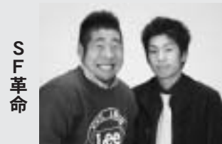
S F 革命