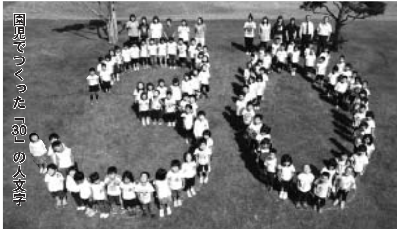
園児でつくった「30」の人文字