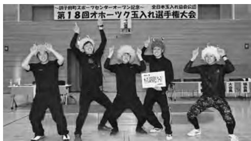
18回大会では姉妹町の高知県津野町から参戦！選手宣誓など、大会を大いに盛り上げました！