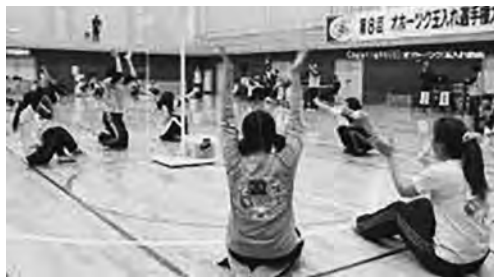
平成20年から22年まで、訓子府のチームが、全日本大会のレディース部門で3連覇達成！