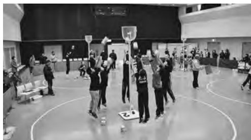
新スポーツセンター建設中は公民館で開催しました！