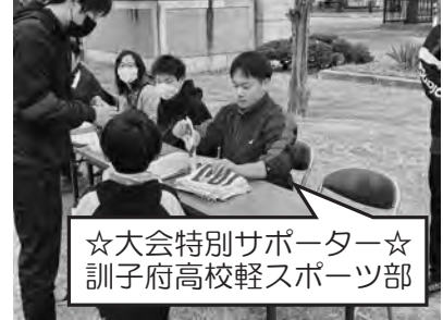
☆大会特別サポーター☆ 訓子府高校軽スポーツ部