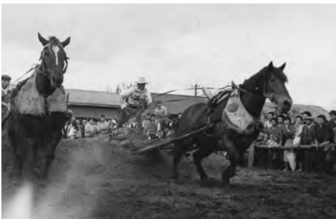
寄贈を受けた写真。ばん馬の勢いが感じられる。

先日、ばん馬に関する資料の寄贈がありました。馬主登録証や馬登録証、騎手免許証、そしてメダルなどをいただきました。