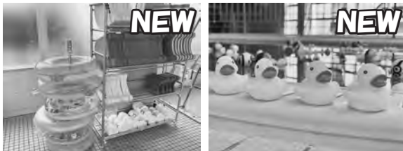
浮輪のレンタルやアヒルフールも毎日実施中です!