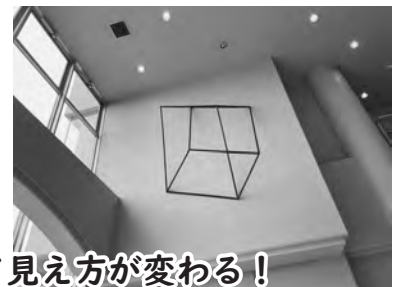
見る角度によって見え方が変わる！