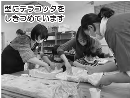
型にテラコッタをしきつめています

今年度から「アート・タウン・プロジェクト」から次のステージ「アートなまちプロジェクト」がスタートします。町民が主体となるワークショップを中心に企画していく予定です。これからは、旅するムサビのワークショップや制作していただいた彫刻作品のメンテナンス、それに関連した参加型の事業を行う予定です。その他にも、やってみたいことや気になること、要望などがありましたら、公民館へお知らせください！