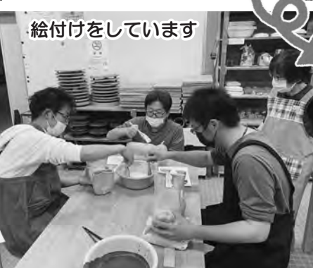
絵付けをしています