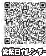
営業日カレンダー