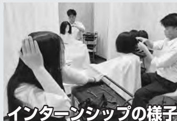
インターンシップの様子

協働農作業では、植え付けから収穫までを体験します。訓子府町の基幹産業の1つである農業を学び、体験したことをまとめ、訓中の生徒に発表！