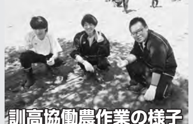
訓高協働農作業の様子

被服実習では、グループで協力し、色々なものを作成します。今回はエプロンです。試行錯誤しながら、作成しています。とても楽しそうですね。