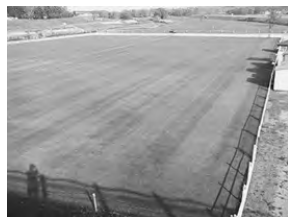
屋外ゲートボール場