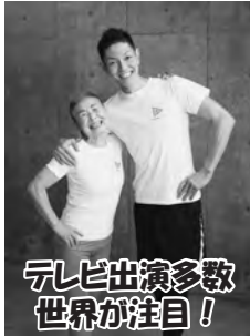
テレビ出演多数 世界が注目!

※この講演会はオホーツク管内社会体育振興セミナーと同時開催となります。 ※当日はロビーにてベジチェック・INBODY測定・簡易血液検査も開催!