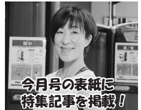
今月号の表紙に 特集記事を掲載!

予約制のパーソナルトレーニングも受け付けています! スポーツセンターへご相談ください!(腰が痛い、膝が痛い、筋力をつけたい)健康づくりのキッカケを全力でサポートします!