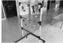
NEWレクリエーション