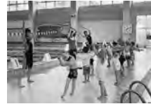
キッズスイミング