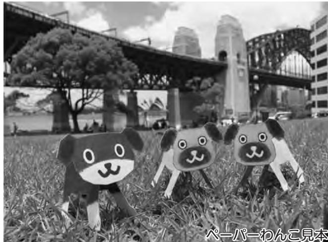
ペーパーわんこ見本

2022年(令和4年)8月号 第340号 発行/訓子府町教育委員会 〒099-1431 北海道常呂郡訓子府町東町400番地 TEL 0157-47-2121/FAX 0157-47-2174