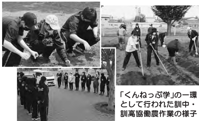
「くんねっぷ学」の一環として行われた訓中・訓高協働農作業の様子

発行/訓子府町教育委員会 〒099-1431 北海道常呂郡訓子府町東町400番地 ☎0157-47-2121/FAX 0157-47-2174