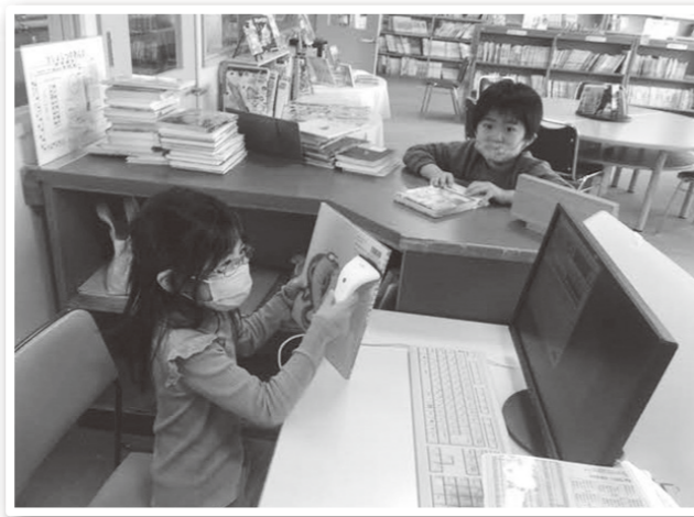
ピッとする機械も子どもたちが扱える!

2022年(令和4年)4月号 第336号 発行/訓子府町教育委員会 〒099-1431 北海道常呂郡訓子府町東町400番地 ☎0157-47-2121/FAX0157-47-2174