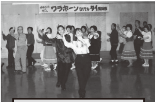
平成4年度 公民館開館10周年記念事業 ありがとう であい・ふれあい こうみんかん

町公民館は昭和57年に現在の場所に建て替えられ、令和4年度に開館40周年を迎えます。「公民館」は町民が主体的に活動・学習するための施設であり、私たちの生活を支える活動や学習の拠点となる大切な施設です。これからもたくさんの町民のみなさんに足を運んでいただきたいと考えています。