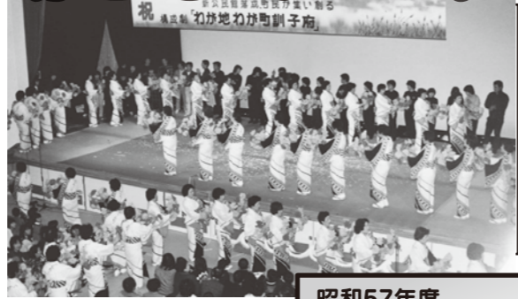
昭和57年度 公民館落成記念事業