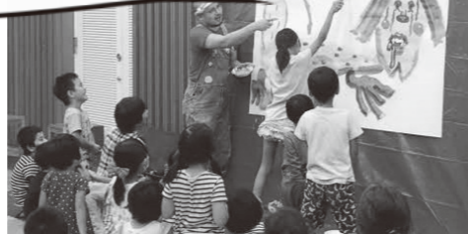
「世界アルツハイマー月間」の展示は、福祉保健課との連携事業です。

「世界アルツハイマー月間」に合わせ、9月は「認知症」についての本を図書館で展示します。小説から絵本、体験記まで、ジャンルを広く集めました。まずは「認知症」を知ることから、はじめてみませんか。