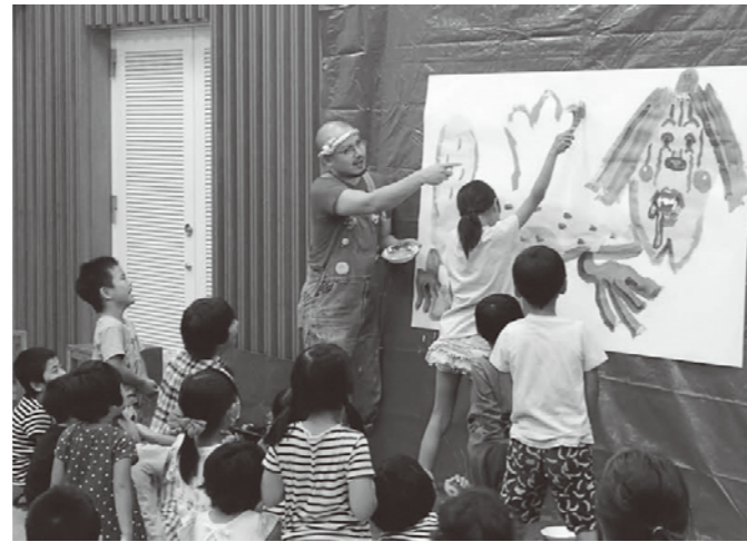
絵本ライブの様子

2021年(令和3年)8月号 第328号 発行/訓子府町教育委員会 〒099-1431 北海道常呂郡訓子府町東町400番地 ☎0157-47-2121/FAX0157-47-2174