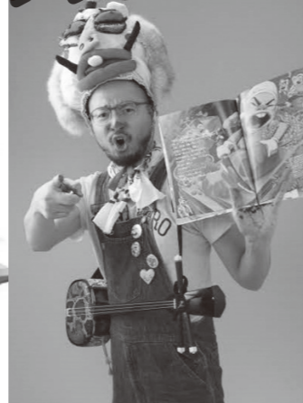
絵本ライブ終了後は、サイン会も予定しております。

現役で活躍されている絵本作家が、目の前で、読み聞かせや絵を描いてくれるなんて…、行くしかない!!!