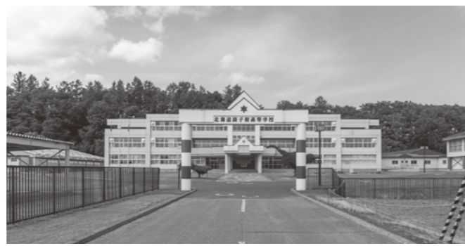
訓子府高等学校のホームページ http://www.kunneppu.hokkaido-c.ed.jp/

2021年(令和3年)7月号 第327号 発行/訓子府町教育委員会 〒099-1431 北海道常呂郡訓子府町東町400番地 ☎0157-47-2121/FAX0157-47-2174