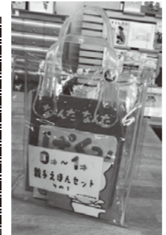
←透明のカバンが目印!

図書館では、乳幼児の年齢別におすすめの絵本を用意した「親子えほんセット」を貸出しています!定期的に、セット内容が変わりますので、何度でも楽しんでいただけます!