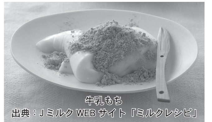
牛乳もち 出典：Jミルク WEB サイト「ミルクレシピ」