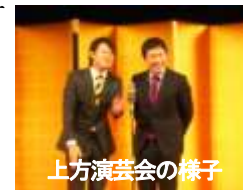
上方演芸会の様子

町制施行60周年を町民の皆様はもとより、「ふるさと応援団」などゆかりの皆様と共に祝い参加していただきながら、訓子府町の新たなスタートにさせていただきたいと夢を膨らませております。