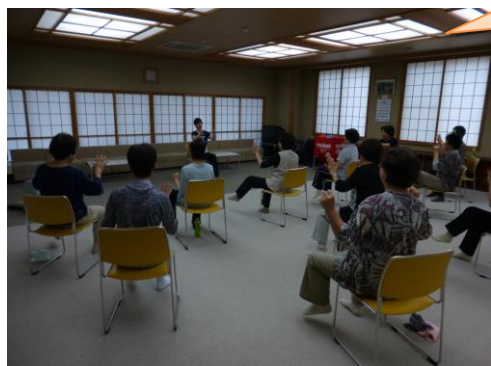
【講座メニューの一例】

町内にお住いの方で構成されるサークルや仲間、地域での集まり等にお邪魔して、健康の講話・運動の指導・趣味に活かせるプログラムを行います。開催場所、内容は希望される方と相談して決定しますので、ぜひお気軽にご利用ください！